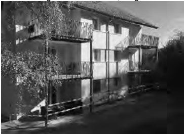
zb. sanierung haus bernstrasse, burgdorf