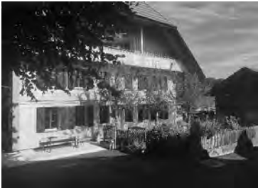
zb. umbau haus in huttwil