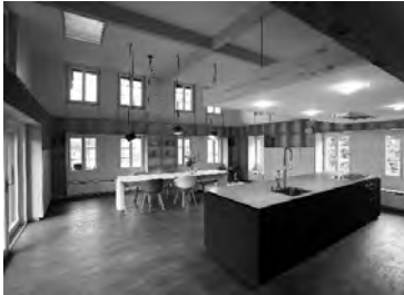
zb. umbau haus in affoltern