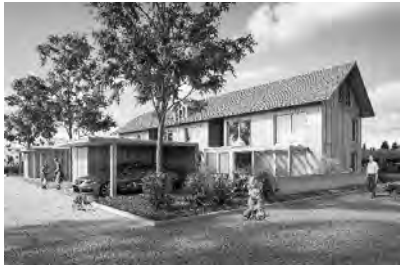
zb. holzbausiedlung in hindelbank