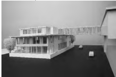
zb. neubau kompetenzzentrum holz in ramsei