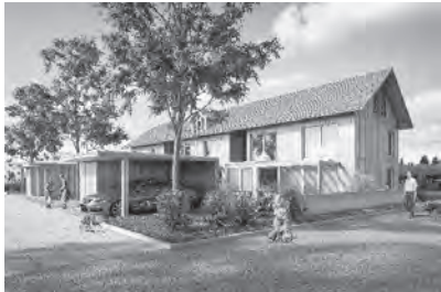
zb. holzbausiedlung in hindelbank