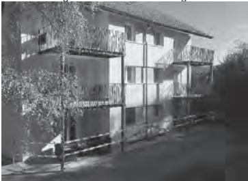
zb. sanierung haus bernstrasse, burgdorf