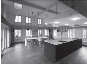
zb. umbau haus in affoltern