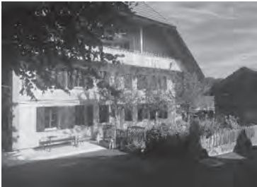
zb. umbau haus in huttwil