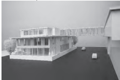
zb. neubau kompetenzzentrum holz in ramsei